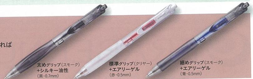
太めグリップ(スモーク) +シルキー油性 (黒・0.7mm)